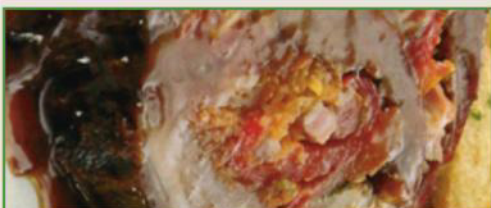
Rollito "La Eskina"