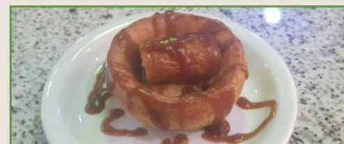
Toad in The hole