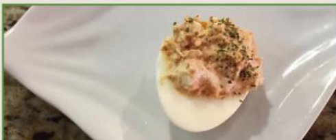
Huevos el Sol