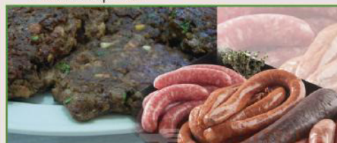
Tapas típicas de Catral con la colaboración de Carnicería Josefica