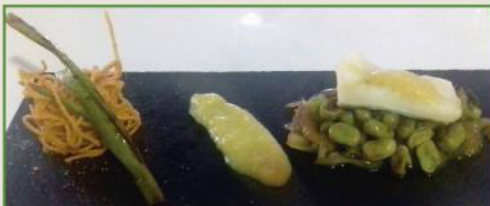
Bacalao confitado con salsa de mango