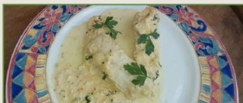
Bacalao con salsa de cebolla crujiente