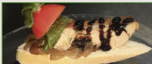
Cochinillo al horno deshuesado con reduccion al Pedro Ximénez