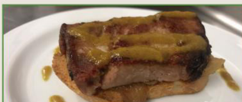
Cinta ibérica asada sobre tosta con cebolla caramelizada