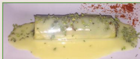
Canelón de morcilla y manzana ácida con crema de queso