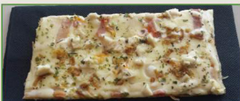
Pizza El Jardín