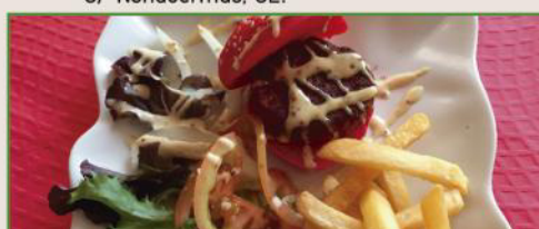
Mini hamburguesa especial