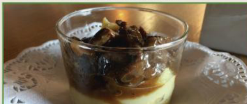
Carrillera de ternera sobre puré de patata trufado