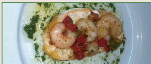
Gamba de Ajo