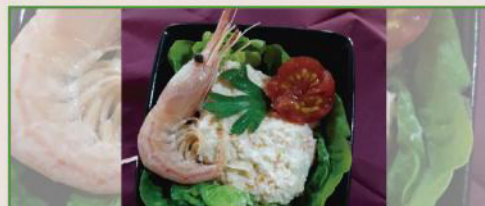
Flor de Marisco