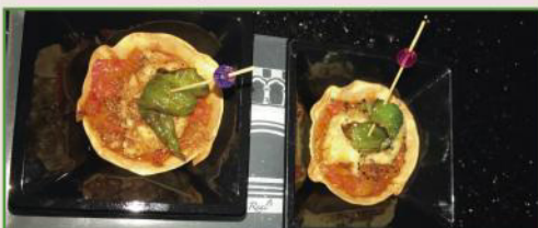
Tulipa de pollo con patata a lo pobre en salsa sorpresa