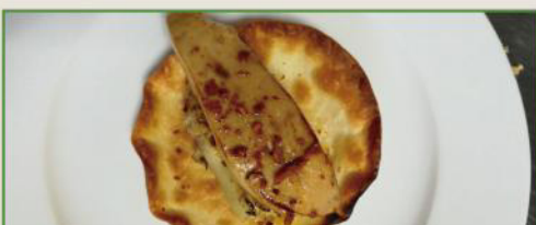
Fantasía de la granja