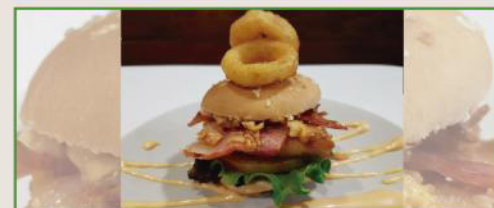
Hamburguesa New York